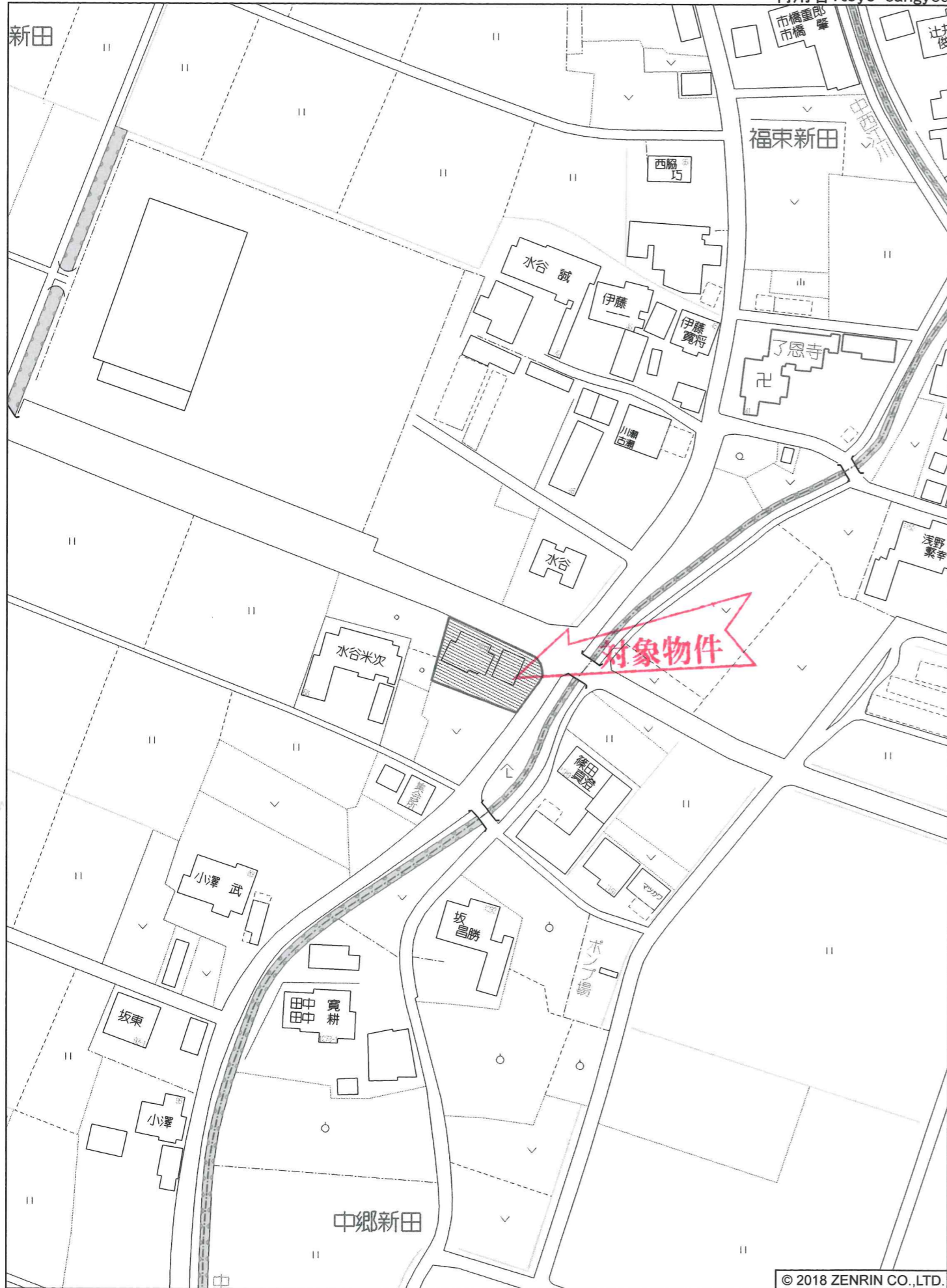
輪之内町福束新田付近